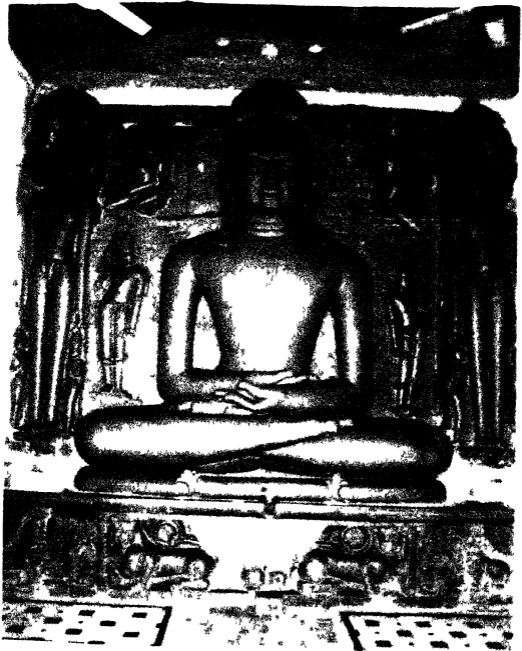
बड बाबा सिद्धक्षत्र कुण्डलपुर (दमाह)

ऐतिहासिक युगप्रवर्तक आदि तीर्थंकर ऋषभदेव